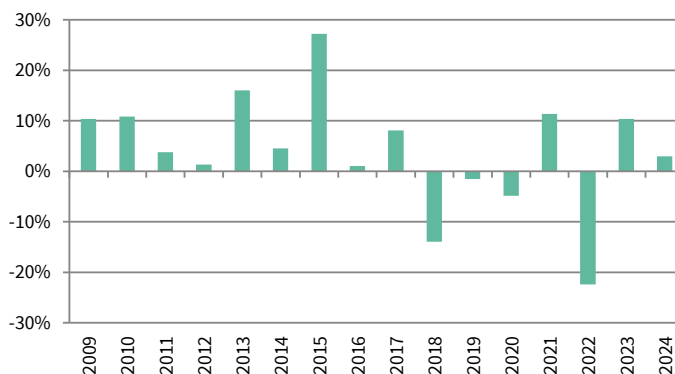
■ Strategic Europæiske Aktier A/S